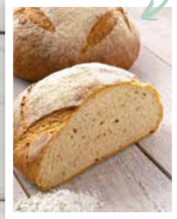
FLEUR DE SEIGLE