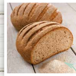
PURE INTÉGRALE FLOCONS