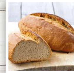
BIO BLANCHE T65