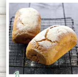
BIO SEIGLE T85