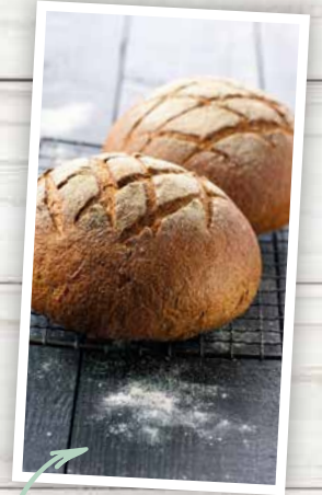
BIO COMPLÈTE T150