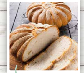
BIO MS T65