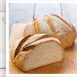
BIO ÉPEAUTRE CRÈME T80